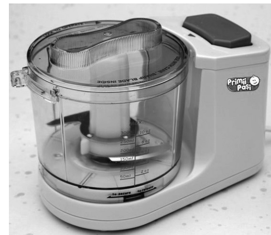
Mixer electric Manual instrucțiuni